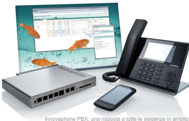
innovaphone PBX: una risposta a tutte le esigenze in ambito Unified Communications