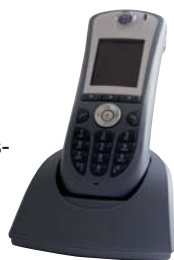
Telefono WiFi innovaphone IP62

L'innovaphone PBX offre la possibilità di integrare la tecnologia DECT, WLAN e GSM . In tal modo i vostri collaboratori sono raggiungibili in ogni momento, anche se in quel preci-