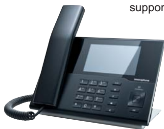
IP232 – Tecnologia raffinata e design eccellente

Grazie al Wizard, l' installazione del Software diventa un gioco da ragazzi , un tool di rollout supporta l'installazione dei terminali mentre l'Update-Server integrato gestisce centralmente tutti gli aggiornamenti dei dispositivi in rete.